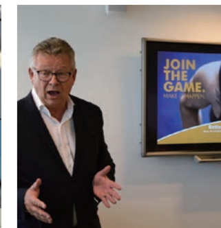
ロッテルダムトップスポーツ