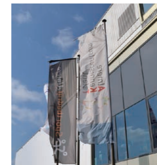
アルメレ才能育成ナレッジセンター

A 荒川河川敷周辺のスポーツ施設や宿泊・飲食・研修施設等のネットワーク化によって、市民がスポーツを「する」場、「学ぶ」場の提供等を目的として、ハード面での実施環境を確保していきたいと考えております。加えて、競技力の向上や指導者、トレーナーなどの育成、スポーツ科学という観点からのデータ分析等を目的として、企業や大学、団体等が持つ最新の知見や技術を活用したソフト面の質の向上にも取り組んで、新たなスポーツ産業の育成につなげてまいりたいと考えています。