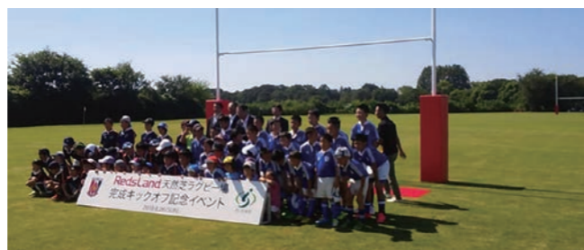
完成イベントに出席