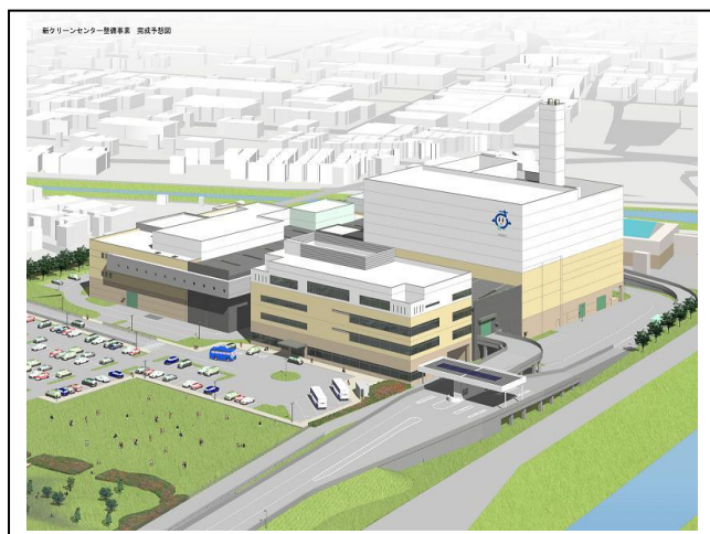
《新クリーンセンターイメージ図》