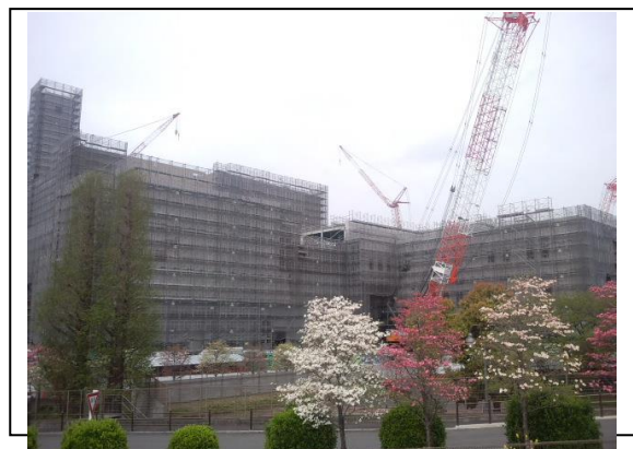
現在の工事の様子（平成 26 年 4 月撮影）