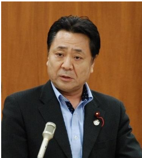
さいたま市議会議員

この予算の中には、来年度4月に稼働が予定されている新開地区の新クリーンセンター整備事業予算や、田島地区内に産業集積拠点を創出するための調査予算など、桜区重点事業の予算が盛り込まれております。今後も地域住民のご意見を反映するべく働いてまいりますので、ご意見ご要望お寄せください。