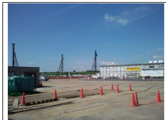
現在の工事の様子（8月8日撮影）