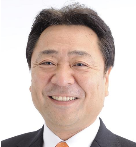
さいたま市議会議員